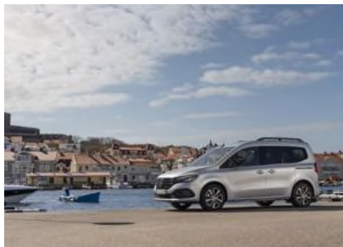
Nuova Mercedes-Benz EQT, elettrica e innovativa