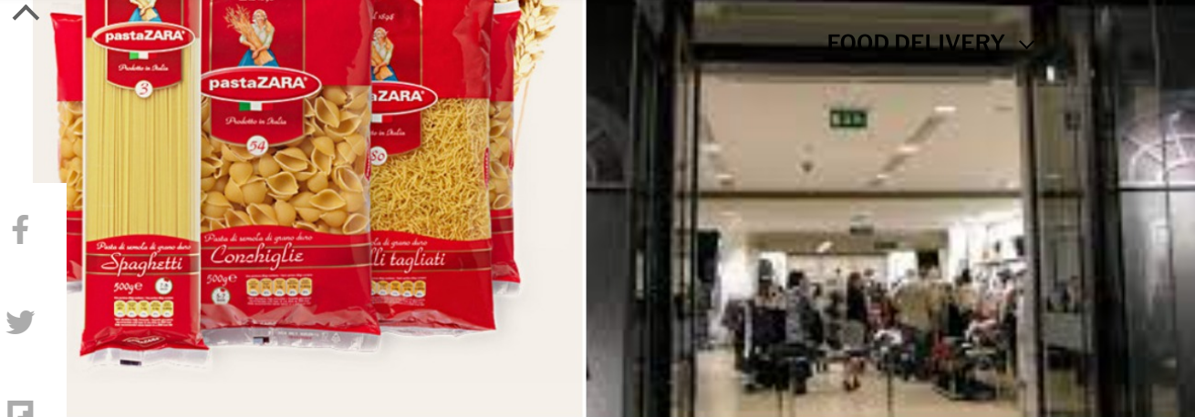
zara contro pasta zara

rauf Italia vince contro il colosso internazionale Inditex. La piccola società di Treviso, specializzata nel settore della ristorazione, conosciuta per il marchio Pasta Zara , è riuscita a tutelare e difendere il proprio marchio contro il noto brand di abbigliamento Zara, appartenente al gruppo iberico Inditex. E' quanto riporta Today.it .