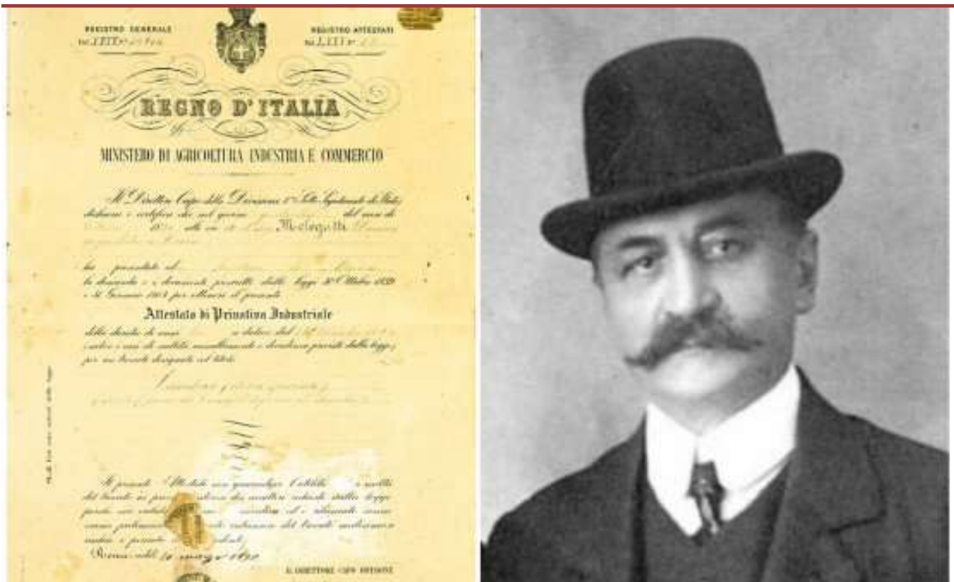
Domenico Melegatti e il brevetto del suo pandoro

«Il primo brevetto di questo genere di cui si ha memoria – spiega Marco Lissandrini , di Bugnion ( https://www.bugnion.eu/it/ ), azienda che ha curato l'iter della registrazione - risale al VII secolo a.c. e riguarda una ricetta depositata a Sibari che riconosceva agli "chef" d'allora un'esclusiva di un anno. E proprio a Verona, nel 1894, Domenico Melegatti ( https://it.wikipedia.org/wiki/Domenico_Melegatti ) brevettò l'intero processo di produzione del suo pandoro. Ora tocca a Perbellini ( https://www.identitagolose.it/sito/it/6/9338/chef-e-protagonisti/giancarlo.html )». Per conoscere la ricetta bisognerà attendere vent'anni, allo scadere del brevetto. Intanto la Milanese cotta e cruda entrerà fuori menu della Locanda Quattro Cuochi ( http://www.locanda4cuochi.it/ ) a Verona e di Locanda Perbellini ( https://www.identitagolose.it/sito/it/62/19980/ristoranti/locanda-perbellini.html?p=0&q=Locanda%20Perbellini&hash-city=cs-city-milano& ) a Milano, a partire dal mese di aprile. A introdurlo ci sarà un libretto che racconterà storia e segreti di questa creazione gastronomica.